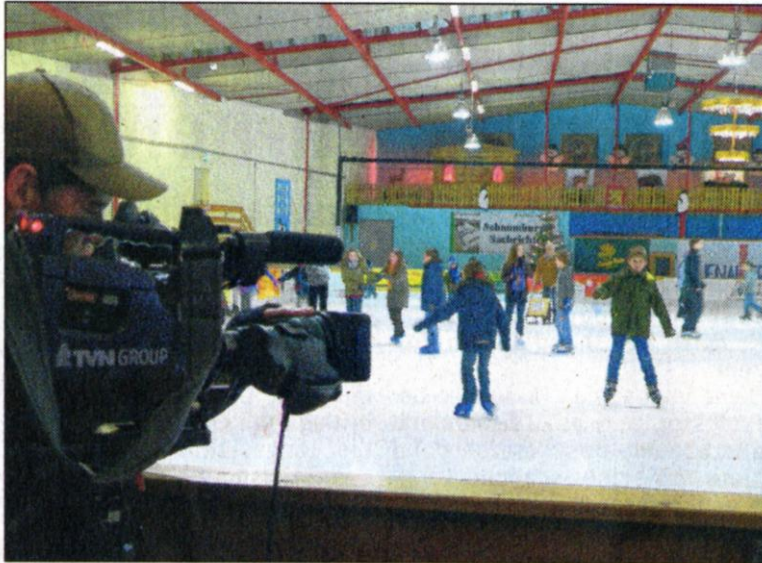
Die Fernsehaufnahmen machen neugierig: Auf dem Eis und in der Halle herrschte viel Betrieb.